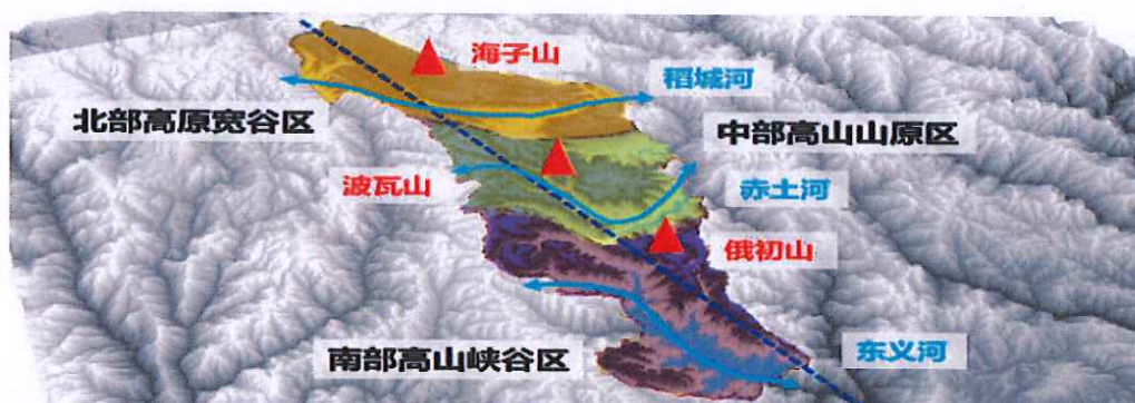
图1 稻城县南北向地形剖面图

我县在1958年3月，进行民主改革，设置稻坝、贡岭2个区，稻坝区辖桑堆、解放、省母、民主、傍河、巨龙6个乡，贡岭区辖木拉、赤土、日瓦、蒙自、东义5个乡。在1963年，建东义区，设各卡、吉噶、俄牙同3个乡，归东义区管辖。现稻坝片区辖邓坡乡、噶通镇、金珠镇、桑堆镇、省母乡、巨龙乡；贡岭片区辖木拉乡、赤土乡、香格里拉镇、蒙自乡；东义片区辖各卡乡、吉呷镇、俄牙同乡。在传统划分基础上，根据历史人文、地理特征、交通区位、产业基础等因素，将全县划分为三个片区，即稻坝生态农旅商贸融合发展片区、香格里拉旅游综合发展片区、东义生态经济协作片区。