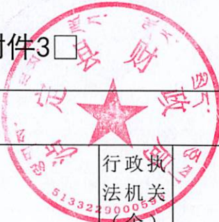
2020年度行政执法和行政执法监督工作情况统计表