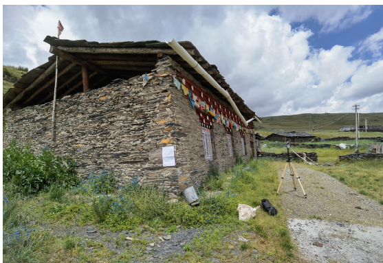
图片 3 现场公示 (色卡乡亚日村)