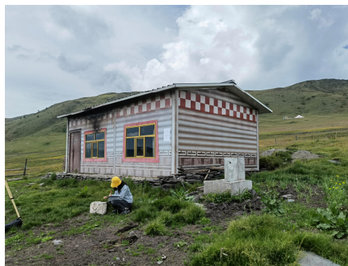
图片 4 现场公示 (色卡乡亚日村)