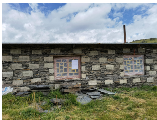
图片 2 现场公示 （色卡乡亚日村）