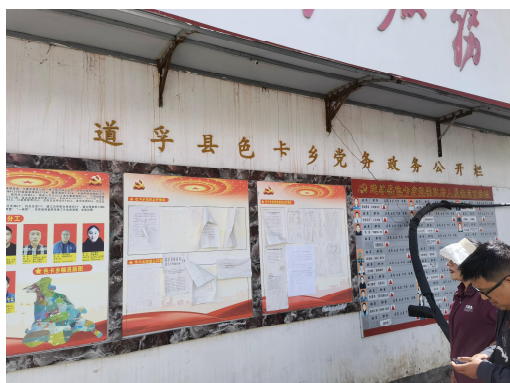
图片 1 现场公示 （色卡乡政府）